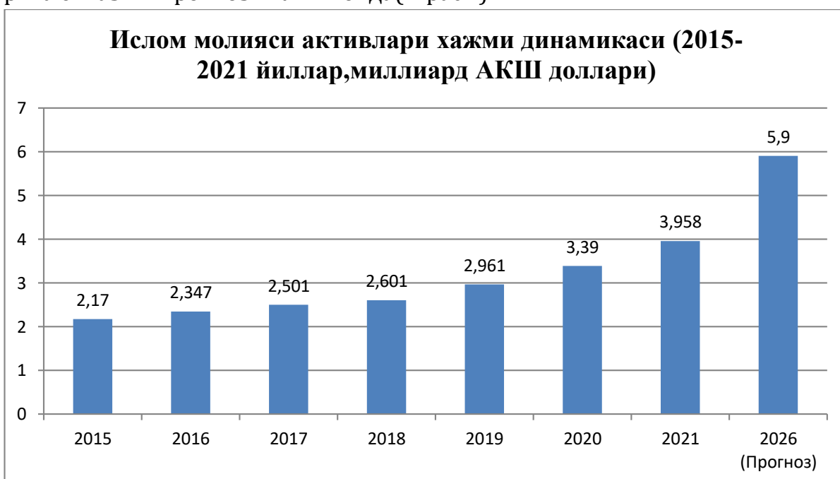
1-расм. 2015-2021 йилларда ислом молияси активлар ҳажми узиш динамикаси,(миллиард АКШ доллари).

Глобал ислом молия саноати узиш тенденциясида давом этмокда ва айниқса, 2021 йилда ислом молияси активлари ҳажми қарийб 4 триллион АКШ долларини ташкил этгани ҳисобга олинса, 2026 йилга бориб бу курсаткич 5,9 триллион АКШ долларига етказиш прогноз килинмокда(1-расм).